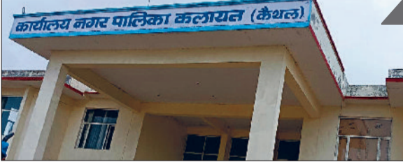
कलायत। कलायत नगर पालिका कार्यालय भवन।