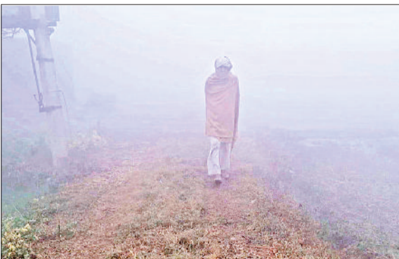
जींद। सुबह के समय खेत में फसल संभालने पहुंचा किसान।