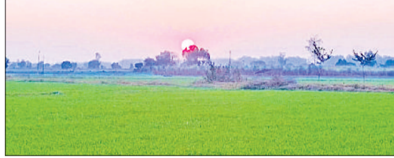
जींद। खेत में खिली फसल, नववर्ष में जिले में उत्पादन बढ़ने की उम्मीद।

हाईटेक सिस्टम लगाए गए हैं। जंक्शन के नए भवन के तैयार होने से शहर के साथ जुड़े आसपास के जिलों के यात्रियों को भी बड़ा लाभ मिलेगा। नए जंक्शन के शुरू होने से क्षेत्र में आर्थिक गतिविधियां बढ़ेंगी और शहर की छवि भी निखरेगी। उम्मीद है कि 2026 में इसका उद्घाटन हो जाएगा। रेलवे जंक्शन अधीक्षक जेएस कुंडू के अनुसार रेलवे जंक्शन का भवन का निर्माण पूरा हो गया है। फिलहाल लिफ्ट और एस्केलेटर