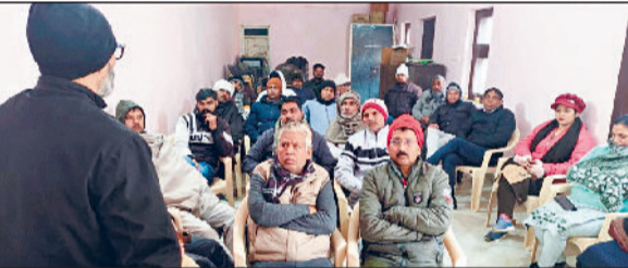
कैथल। कर्मचारियों को संबोधित करते नेता।