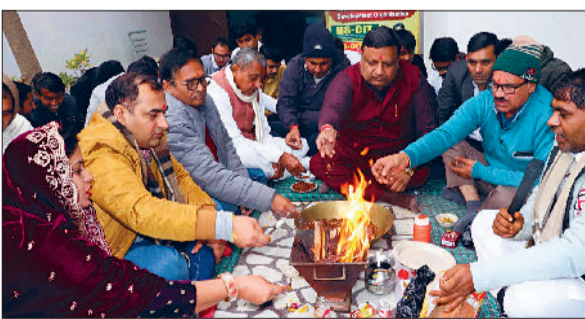
जींद। यज्ञ में आहुति डालते हुए।