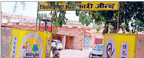
जींद। जिला शिक्षा अधिकारी कार्यालय।

हरियाणा में नए साल के पहले दिन से सभी सरकारी और निजी स्कूल 15 दिन के लिए बंद रहेंगे। शिक्षा विभाग ने इस संबंध में नोटिफिकेशन जारी किया जा चुका है। यह अवकाश सभी कक्षाओं के लिए होगा। छात्रों और शिक्षकों के लिए यह अवकाश राहत भरा रहेगा। शिक्षा विभाग द्वारा जारी आदेश में कहा गया है कि सभी सरकारी और निजी स्कूलों में 1 जनवरी से 15 जनवरी तक शीतकालीन अवकाश रहेगा। 16 जनवरी से सभी स्कूल नियमित रूप से खुलेंगे।