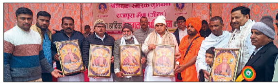
जींद। सांसद ब्रह्मचारी ने कार्यक्रम में भाग लिया।

सोनीपत-जींद सांसद सतपाल ब्रह्मचारी ने कहा कि राष्ट्र और समाज के प्रति सेवा भाव से समर्पित होकर अपनी कुर्बानी देने वालों को हमेशा याद रखना चाहिए। उनकी स्मृति में कार्यक्रम आयोजित होते शारीरिक एवं मानसिक स्वास्थ्य को सुदृढ़ करने की विधियों से विद्यार्थियों को अवगत करवाया।