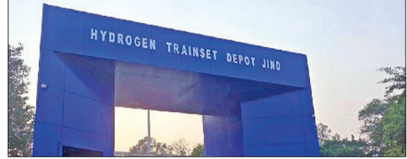
जींद। हाइड्रोजन प्लांट बनकर तैयार।

का काम चल रहा है। यात्रियों को अभी उद्घाटन की तारीख भवन की सुविधा मिलने लगी है। निर्धारित नहीं हुई है।