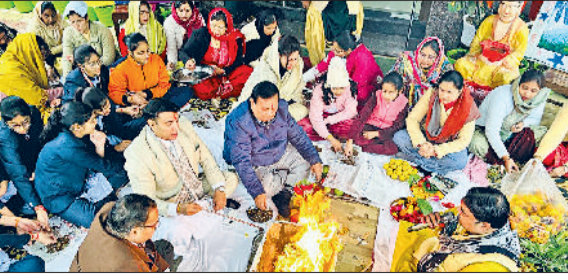
जीद। हवन में आहुति डालते चेरमने-प्राचार्य और अन्य।

मोतीलाल नेहरू पब्लिक विद्यालय में राष्ट्रीय सेवा योजना के सात दिवसीय विशेष शिविर का शुभारंभ वैदिक मंत्रोच्चारण एवं हवन यज्ञ के साथ अत्यंत श्रद्धा, अनुशासन एवं सकारात्मक वातावरण में किया गया। नए वर्ष एवं आगामी शिविर गतिविधियों को ध्यान में रखते हुए यह हवन यज्ञ विद्यालय परिवार, विद्यार्थियों तथा समाज में सुख समृद्धि, शांति और सद्भाव बनाए रखने की मंगलकामना के साथ संपन्न हुआ। इस पावन अवसर पर एनएसएस से जुड़े सभी स्वयंसेवकों